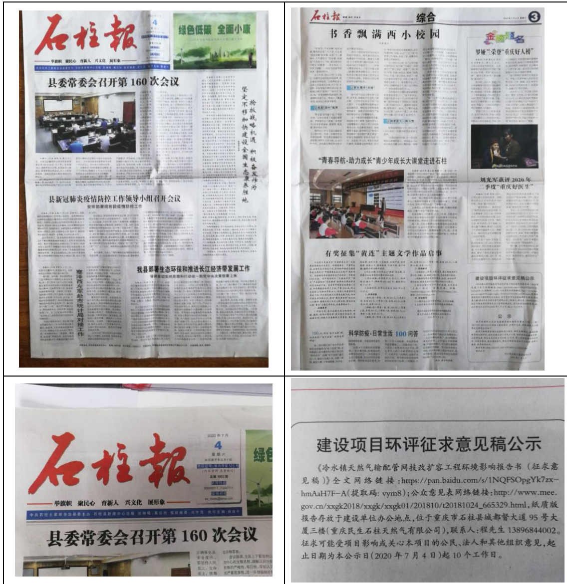
2020 年 7 月 4 日报纸公开信息