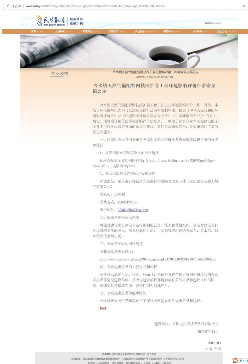
图 2 征求意见稿网络公示截图

网络公示时间为 2020 年 7 月 2 日至 2020 年 7 月 15 日，网址链接为 http://www.msny.cc/%E4%BC%81%E4%B8%9A%E5%85%AC%E5%91%8A/tabid/107/articleType/ArticleView/articleId/3451/language/zh-CN/Default.aspx 。网络公示截图如下：