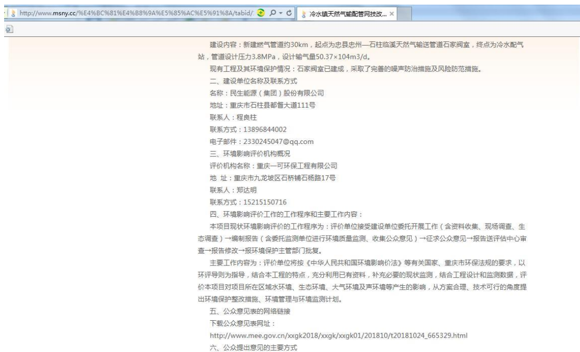
图 1 第一次网络公示截图